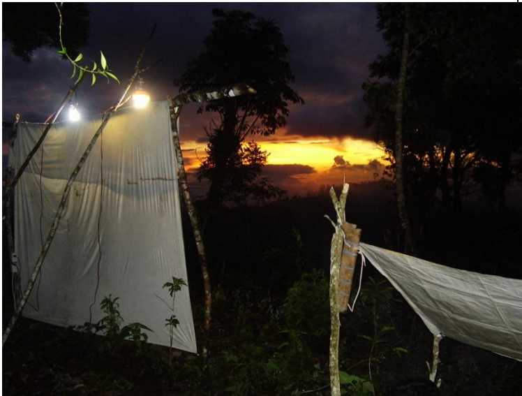
ライトトラップ風景

上記の写真のように白い布を張り、ライトアップします。そうするとたくさんの昆虫が集まってきます。昆虫は、白い布だけではなく、近くの木や地面にも来ます。大自然の山の中で食事をしながら、いろいろな昆虫が飛んでくるのを見るのは、とても楽しいです。