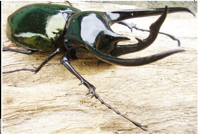
コーカサスオオカブト

上記の写真のように白い布を張り、ライトアップします。そうするとたくさんの昆虫が集まってきます。昆虫は、白い布だけではなく、近くの木や地面にも来ます。大自然の山の中で食事をしながら、いろいろな昆虫が飛んでくるのを見るのは、とても楽しいです。