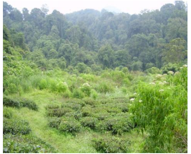
スカブミでのライトトラップの場所 この山からカブト、クワガタが飛んできます。