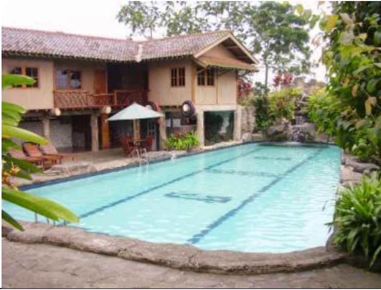
チキダン ハンティング リゾート